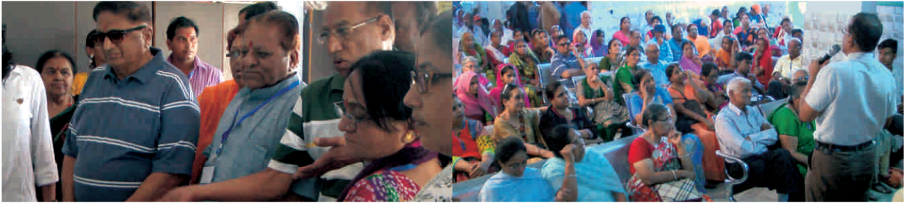
बुजुर्गों की बात सुनते हुए