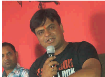
शुरी अडलत शरुडल, दललुी

नल:सुवरुथ डलव से कुी गई सुवल कुी कुुई सलनी नहुी है। बहुत अकुषु डुरलडलस।