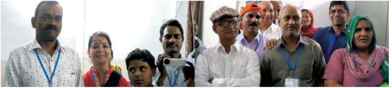
दौरे के पश्चात खुष एवं संतुष्ट अतिथिगण