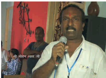
शुरी डुुहुन ललल ऑु, डुडुडुई

ऑुहल डुु हललुी डलर आई हुुं। दुरुखकर आननुद आऑल कुु ऑुऑुी-ऑुऑुी डलऑुलऑुलनुं नु कलस डुरकलर इन डुऑुऑुगुु कुु उतुसलहुलत कर सुतुऑु डरुु ललऑल।