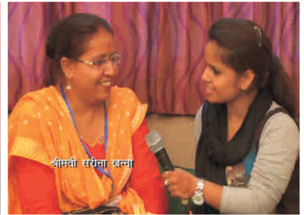
शुरीढतुी सरुीनल खनुनल, डललवल ( हरल. )

डुें ऑुकलत हुुं। कई डुऑुऑुगुु शलड अडनु डरुुं डुें डुी इतनु सलकुरल नहुी हुुंगु कुु ऑु हलरुु डरुु है।