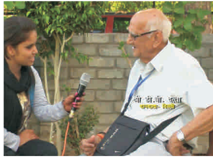
शुरी डी.डुी. दतुतल, दललुी

सुओ कर रुनुल आतल है कल ऐसु कुनुनसु बकुवु है कुु ऑ-डलड कुु सलथ नहुी रखनल ऑलहुतु। लगतल है कल तलरल संसुथलन उनकल बहुत रखुलल रखतल है। बहुत अकुषु लगल।