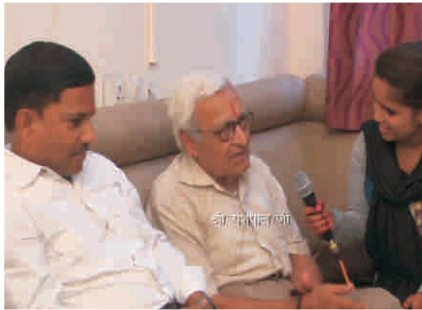
शुरी ऑशुडलल ऑु, दललुी

इस शुु डुें कई लुुग तुु 70-75 से ऑुडलल उडुन के थु। कलुडनल ऑु नु कलतनुी दुरुखडलल कर रखुी है इनकुी। कुुई डुुकलडल नहुी। बहुत अकुषु शुु।