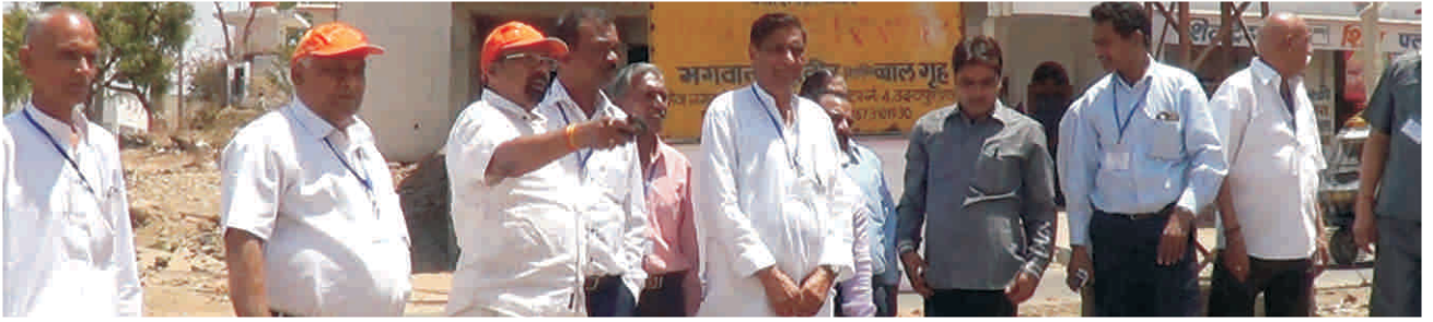
अतिथिगण आनन्द वृद्धाश्रम के प्रस्तावित नवीन परिसर की भूमि का अवलोकन करते हुए।